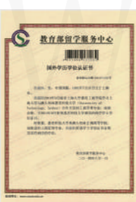
国外学历学位认证书