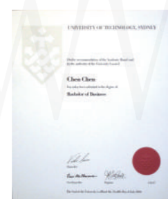
悉尼科技大学商学士学位

所有国外大学学位证书在我国都必须获得教育部留服中心认证书，否则视为无效证书。毕业生学历学位的认证是保护学生和办学者合法权益的重要措施。目前，中外合作办学颁发境外学历学位认证工作主要分为三个部分，办学单位颁发证书认证注册信息，学生个人证书认证申请和个人申请认证注册号查询。