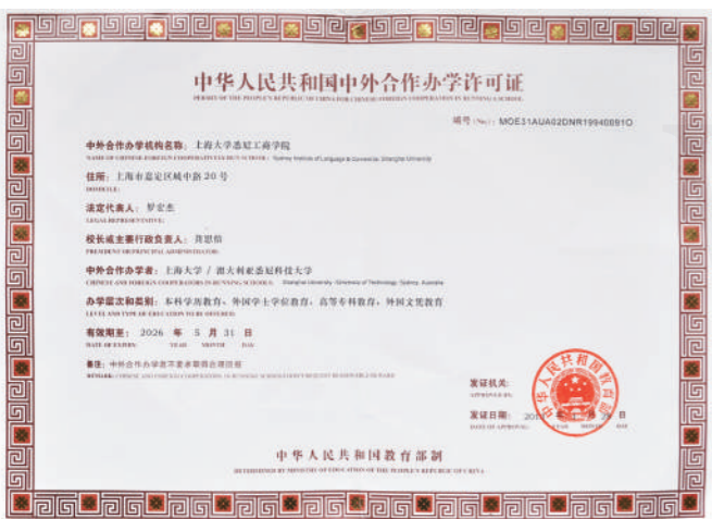
中华人民共和国教育部