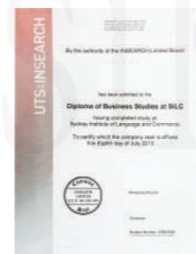
悉尼科技大学高等教育文凭